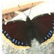
BOREAL FOREST: BUTTERFLIES