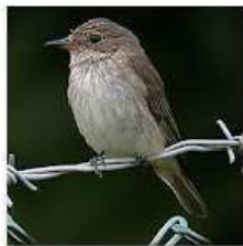
BOREAL FOREST: BIRDS