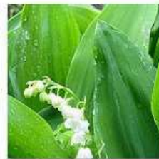
BOREAL FOREST: WILD FLOWERS