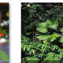
TROPICAL FOREST: SHRUBS