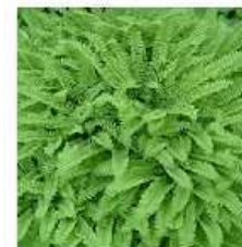
TEMPERATE FOREST: SHRUBS