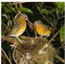
TEMPERATE FOREST: BIRDS