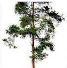
BOREAL FOREST: TREES

Las fotos e información que usted envíe se actualizarán en la Biblioteca En Línea de Fotos del Bosque. Un enlace a estos álbumes estarán disponibles más adelante en www.enotreeday.net