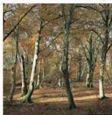
TEMPERATE FOREST: TREES