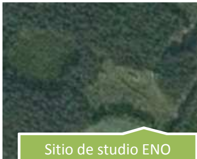
Sitio de estudio ENO 30x30 m