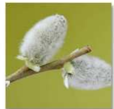
BOREAL FOREST: SHRUBS