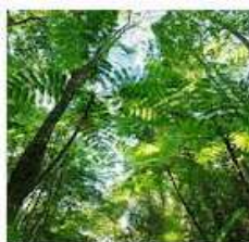
TROPICAL FOREST: TREES