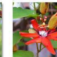
TROPICAL FOREST: WILD FLOWERS