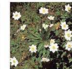
TEMPERATE FOREST: WILD FLOWERS