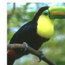
TROPICAL FOREST: BIRDS