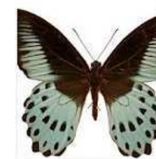
TEMPERATE FOREST: BUTTERFLIES